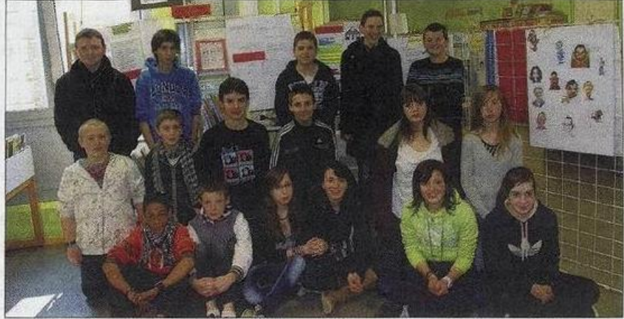
Les élèves de 4 e ont travaillé sur Philippe Geluck et son célèbre «Chat».

Chaque année, au printemps, les enseignants de tous niveaux et de toutes disciplines sont invités à participer à la Semaine de la presse et des médias dans l'école. Activité d'éducation civique, elle a pour but d'aider les élèves, à comprendre le système des médias, à former leur jugement critique, à développer leur goût pour l'actualité et à forger leur identité de citoyen. Le thème de la 24 e Semaine de la presse est : «Des images pour informer». Les images, construisent l'actualité, qu'elles soient fixes ou animées, qu'on les trouve à la télévision, sur les sites, dans la presse ou à la radio, car là aussi les mots font images. Ce thème incite à s'interroger sur la place des images, leurs sources et leur genre. La Semaine est, pour les élèves, l'occasion pour s'attacher à façonner leurs propres images, inédites, originales, révélatrices du rap-