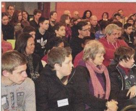
entre l'école et l'entreprise, Une salle pleine.