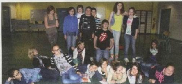
Les comédiens du collège Maurice Genevoix sont prêts à monter sur scène.