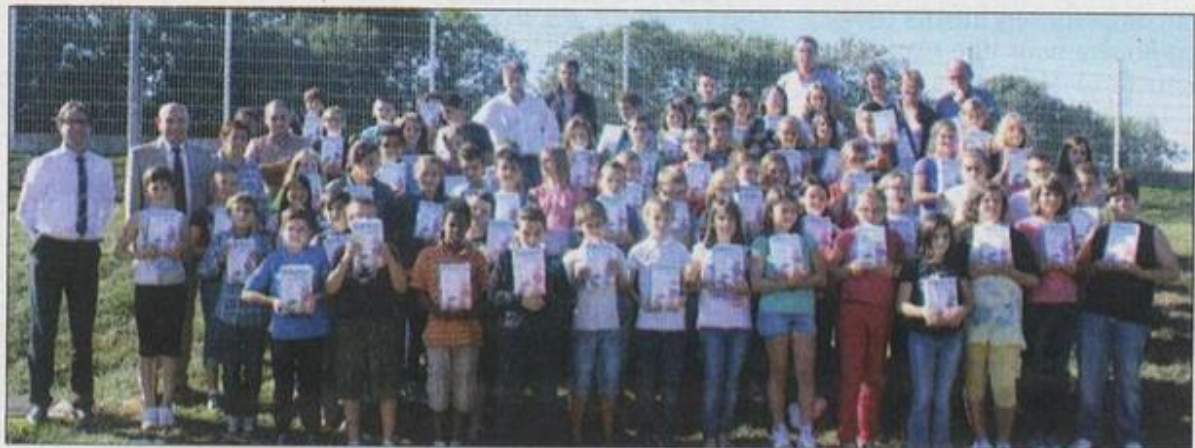
Les élèves ont reçu leur dictionnaire, offert par le Sivos.

Tous les ans, le Syndicat Intercommunal à Vocation Scolaire, Sivos, offre aux élèves de 6 e un dictionnaire pour bien travailler.