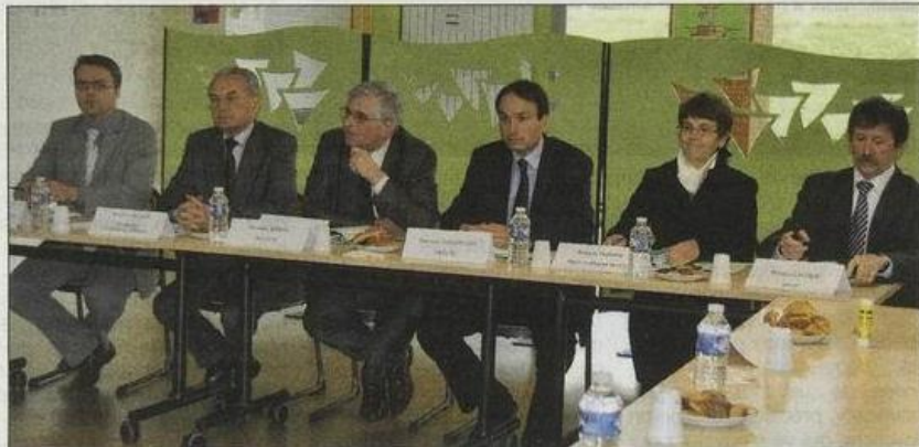
La semaine dernière, le recteur d'académie, entouré de nombreux officiels, a découvert le travail de l'établissement autour des relations entre les élèves et les entreprises.

Le collège dispose également d'une option de découverte professionnelle. «Cette année, 16 élèves de 3 e suivent 3h de cours par