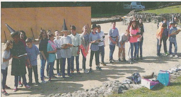
Les collégiens de Grand champ se sont produits dans le théâtre de la cité antique.

Sur la scène du théâtre antique, devant près de 200 collégiens et lycéens spectateurs, tous latinistes, venus de la Mayenne et de Maine-et-Loire ont donné un spectacle endiablé dans lequel un rôle avait été attribué à chacun des 24 participants. Les mots "Gratis, maximum, quiproquo, grosso modo, recto verso et, bien sûr, et cætera" ont résonné dans ce théâtre gallo-romain faisant revivre le temps d'une matinée l'origine de la langue et de la culture française.