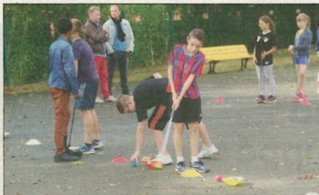
Les élèves ont notamment pu s'essayer au golf.