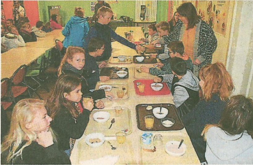
Les élèves de 6 e ont été sensibilisés aux bienfaits du petit-déjeuner.

Jeudi matin, le collège du Grand-Champ organisait au collège une « opération P'tit Déjeuner », auprès de 79 élèves de 6 e .