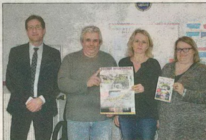
L'association des parents d'élèves et le principal du collège.

Pratique - 8€ adulte, 5€ enfant de moins de 16 ans. Le but de cette soirée est de récolter des fonds et participer aux sorties des élèves : théâtre, voyage scolaire en Allemagne, cinéma... Et l'achat de matériel informatique. Pour tout renseignement ou inscription s'adresser au 06 87 66 42 51.