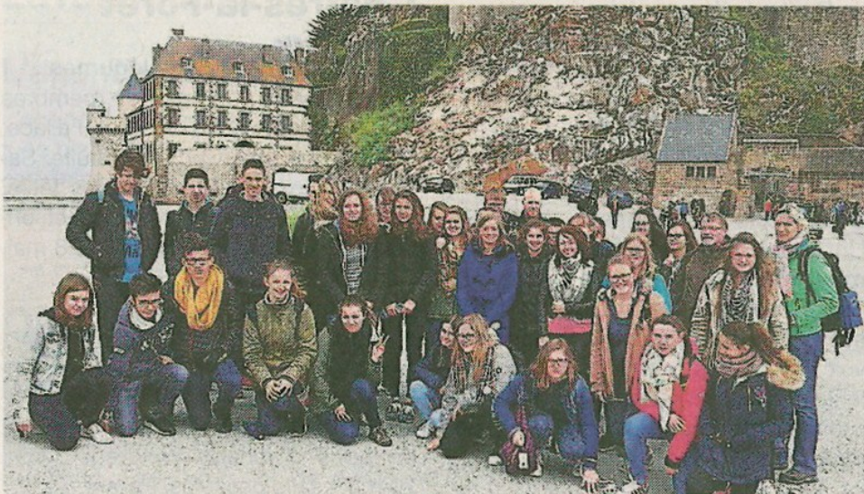
Lors de la visite du Mont-Saint-Michel.

Dans le cadre de l'échange franco-allemand, les élèves du collège Le Grand Champ, accompagnés de leurs correspondants, sont allés, lundi, visiter le Mont-Saint-Michel.