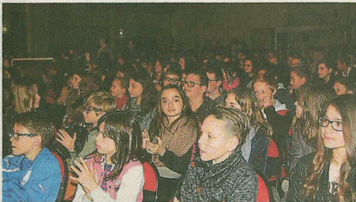
Mercredi matin, ils étaient 720 élèves à assister au concert de Marabout Orkestra.

« Ça va ?? J'espère que ce morceau vous a un peu réveillé ! » Mercredi matin, 10 h passés, à la salle socioculturelle. Le groupe Marabout Orkestra fait face à 720 élèves. Des collégiens des établissements Maurice-Genoix et Saint-Joseph, de Meslay-du-Maine, du collège Le Grand champ de Grez-en-Bouère et des CM1-CM2 de La Gravelle. Invités à assister à un concert dans le cadre du festival Ateliers jazz de Meslay-Grez.