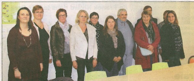
Les parents d'élèves prévoient notamment l'organisation d'un loto le 1 er avril à la salle des sports de Grez-en-Bouère et ce n'est pas un poisson.